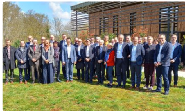
Assemblée Générale de l'USH des Pays de la Loire 7 avril 2023

Par ailleurs, aura eu lieu en 2023 l'installation du nouveau Conseil Régional de Concertation suite aux élections des représentants des locataires fin 2022.